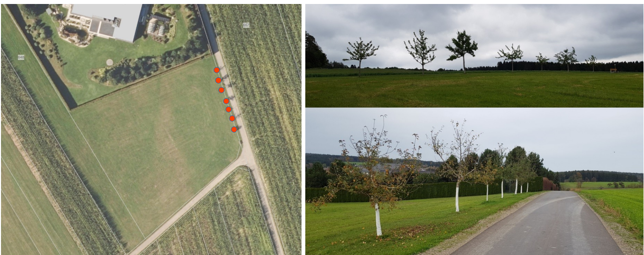
Abb. 6: Baumbestand auf der offenen Grünfläche des Plangebietes

Innerhalb des Gebietes gedeihen neben den Gehölzen und Hecken des vom Eingriff nicht in Anspruch genommenen Privatgartens sieben jüngere Streuobstbäume auf der freien Grünfläche. Bei diesen Bäumen handelt es sich um gepflegte hochstämmige Apfelbäume mit Stammdurchmessern zwischen 7-18 cm in 1 m Höhe. Keiner der Bäume weist Spalten oder Höhlen auf, die höhlen- oder nischenbrütenden Vogelarten als Nistplatz oder Fledermäusen als Quartier dienen könnten. Auch Nester von Zweigbrütern konnten bei den Begehungen in den Kronen nicht festgestellt werden.