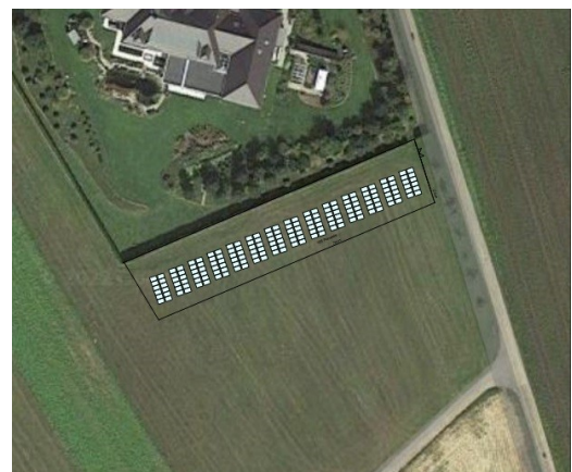
Abb. 2: Visualisierung der Freiflächen Photovoltaikanlage im Gelände südlich eines bestehenden Privathauses und Gartenflächen

Nachdem mit der Neufassung des Bundesnaturschutzgesetzes (BNatSchG) vom Dezember 2007 das deutsche Artenschutzrecht an die europäischen Vorgaben angepasst wurde, müssen bei allen genehmigungspflichtigen Planungsverfahren und bei Zulassungsverfahren nunmehr die Artenschutzbelange entsprechend den europäischen Bestimmungen durch eine artenschutzrechtliche Prüfung berücksichtigt werden.