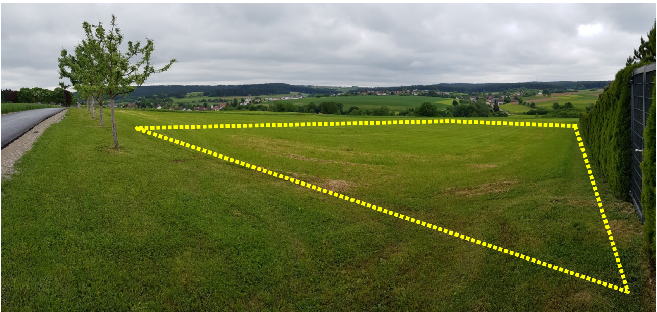
Abb. 9: Übersicht über das für die Errichtung einer Freiflächen Photovoltaik-Anlage herangezogene Grünland

Ein Kollisionsrisiko für fliegende Tiere wie Vögel, Fledermäuse und Fluginsekten ist bei Photovoltaik-Anlagen theoretisch gegeben, da diese als Hindernisse in den Luftraum ragen und möglicherweise unter bestimmten Umständen (z.B. sehr schlechte Sichtbedingungen) nicht rechtzeitig als solche wahrgenommen werden können. Dieses Risiko unterscheidet sich jedoch nicht von dem anderer Hindernisse wie beispielsweise Gehölzen oder Gebäuden und ist bei der Eingriffsbeurteilung wohl vernachlässigbar.