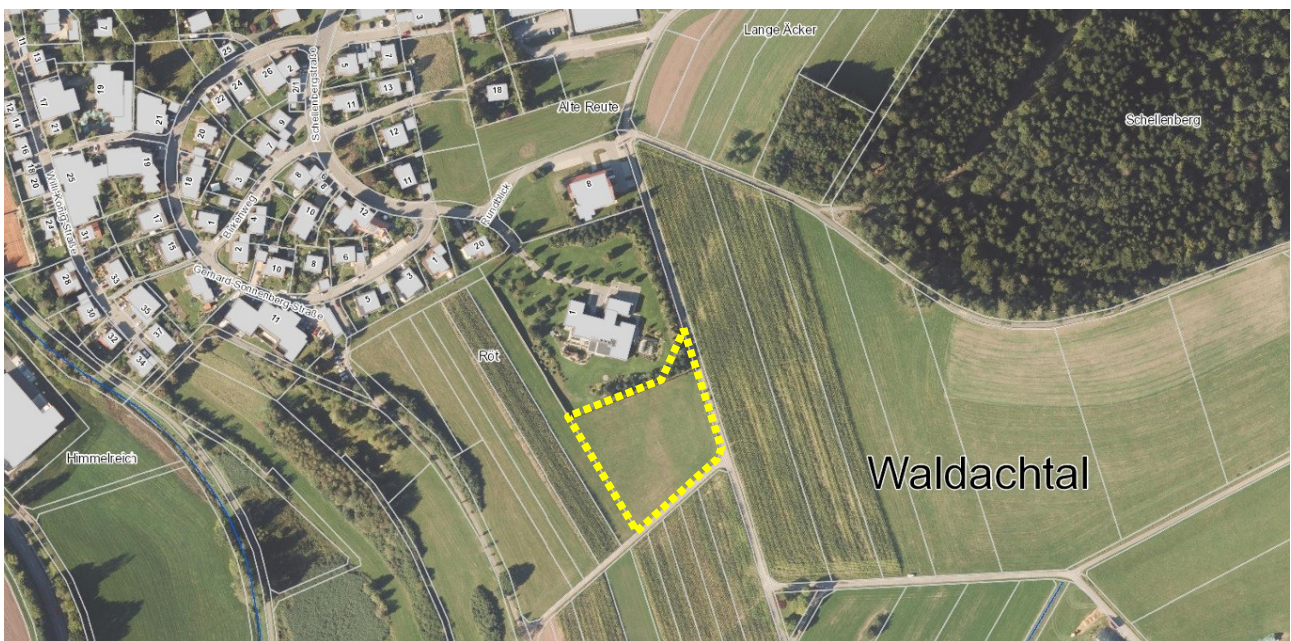
Abb. 3: Ausschnitt aus dem Orthofoto.

Während der Geltungsbereich insgesamt etwa 6240 m 2 umfasst, werden hiervon lediglich etwa 2022 m 2 für die Errichtung der Photovoltaikanlage (Sondergebiet PV) herangezogen. Im nordöstlichen Winkel sind 642 m 2 einem bestehenden Hausgarten zuzuordnen und werden von den Planungen nicht weiter in Anspruch genommen.