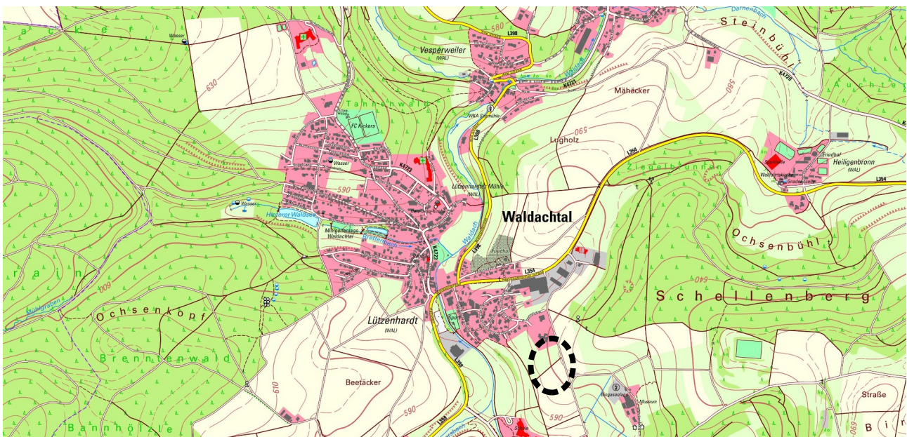
Abb. 1: Übersichtskarte mit der Lage des Plangebietes (schwarz gestrichelt).

Anlass für den vorliegenden Artenschutzbeitrag ist die Aufstellung des Bebauungsplanes „Schafhofäcker – Erweiterung Teil II“ in Waldachtal-Tumlingen im Landkreis Freudenstadt. Ein privater Vorhabensträger plant die Errichtung einer Freiflächen-Photovoltaikanlage (etwa 2022m 2 Fläche mit Paneelen bestanden), was die Gemeinde im Rahmen der Förderung regenerativer und nachhaltiger Energieformen begrüßt. Der Geltungsbereich des Bebauungsplans wird aus dem Abgrenzungsplan und dem zeichnerischen Teil zum Bebauungsplan ersichtlich.