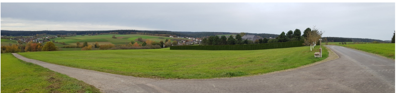
Abb. 4: Übersichtsfoto des Gebiets