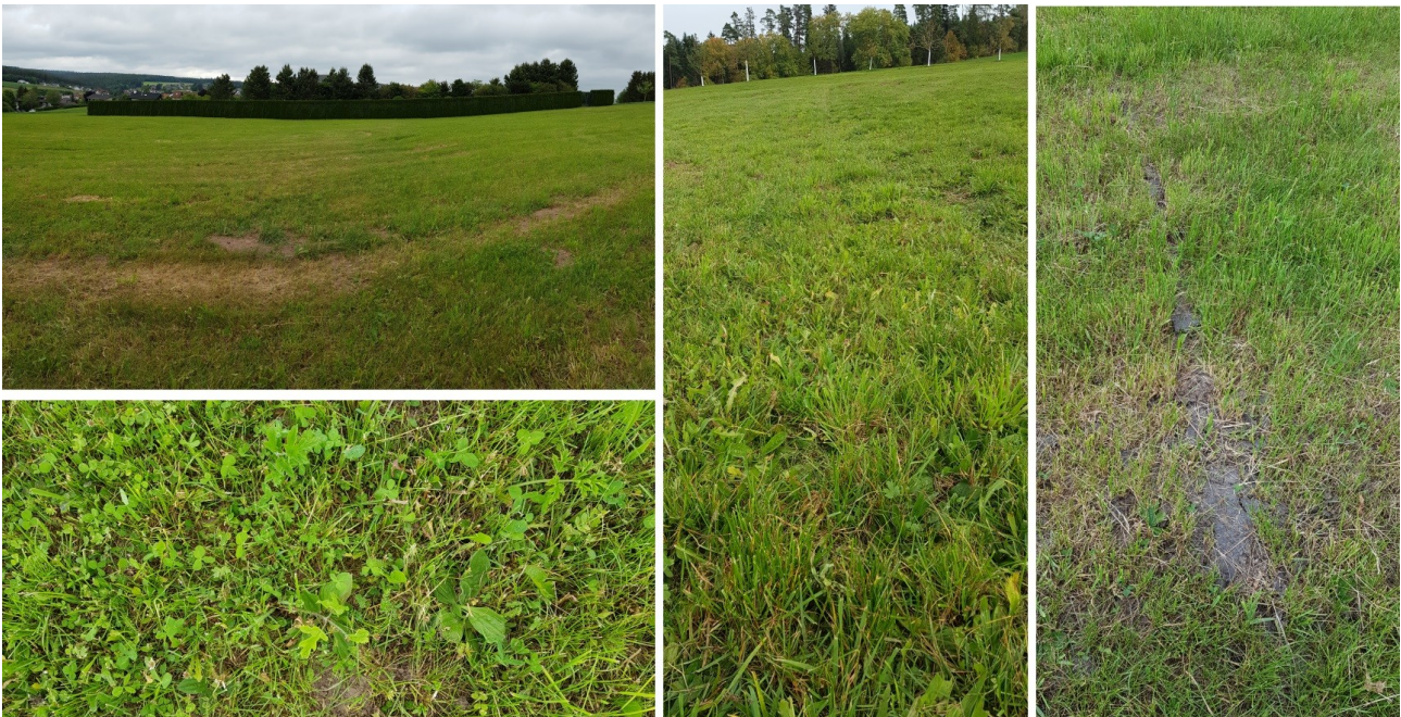
Abb. 5: abgemähte Wiesenvegetation bei beiden Begehungen

Im Datenauswertbogen der LUBW sind im Bestand der ausgewiesenen Mähwiese zusätzlich Wiesen-Kerbel ( Anthriscus sylvestris ), Wiesen-Flockenblume ( Centaurea jacea s. str.) Echte Luzerne ( Medicago sativa ) und Orientalischen Wiesenbocksbart ( Tragopogon orientalis ) genannt. Diese Arten konnten bei den Begehungen nicht registriert werden, was aber unter Umständen auch auf den kurzen Schnitt zurückzuführen ist.