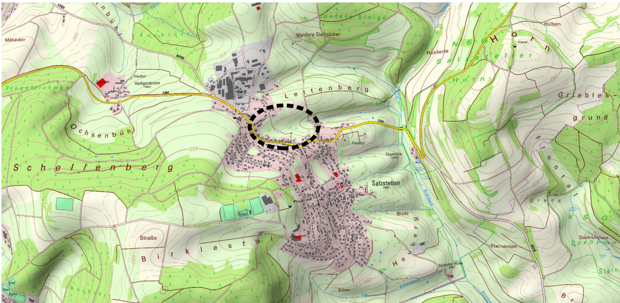
Abb. 1: Übersichtskarte mit der Lage des Plangebietes (schwarz gestrichelt).

Anlass für die vorliegende artenschutzrechtliche Stellungnahme ist die im Rahmen der 2. Änderung des Flächennutzungsplans 2030 des Gemeindeverwaltungsverbandes Dornstetten geplante Neuausweisung der Wohnbaufläche ‚Neubaugebiet Raitäcker‘ in Salzstetten im Waldachtal. Auf der etwa 5,6 ha großen Fläche ist die Errichtung neuer Wohnbebauung vorgesehen.